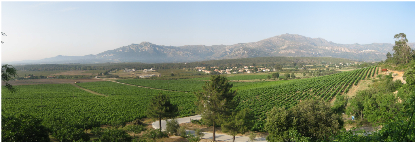
3. I vigneti di Calenzana, Corsica.

Questo documento, che riporterà al suo interno le linee guida, costituirà un vero e proprio "oggetto-pretesto" per la verifica continuativa da parte di tutti i soggetti interessati che accederanno al sito web del progetto.