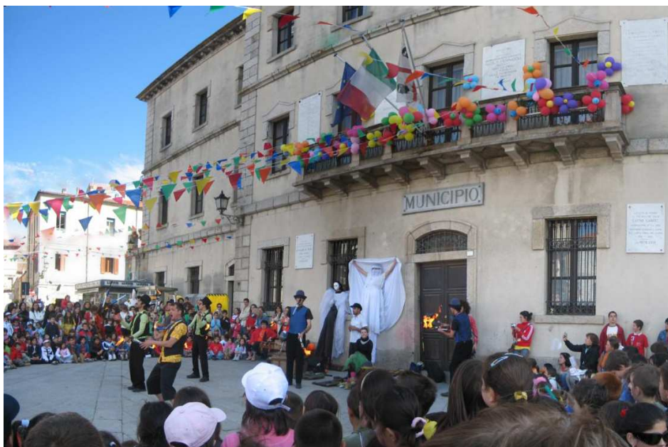
4. La festa conclusiva della prima edizione del concorso Kaleidos nel centro storico di Tempio Pausania.

Nell'ambito del progetto verranno organizzati quattro workshop e quattro eventi transfrontalieri sui temi del paesaggio e dell'identità locale. Saranno importanti momenti di confronto sia interno al partenariato che verso l'esterno, e daranno la possibilità di divulgare i risultati delle azioni di progetto.