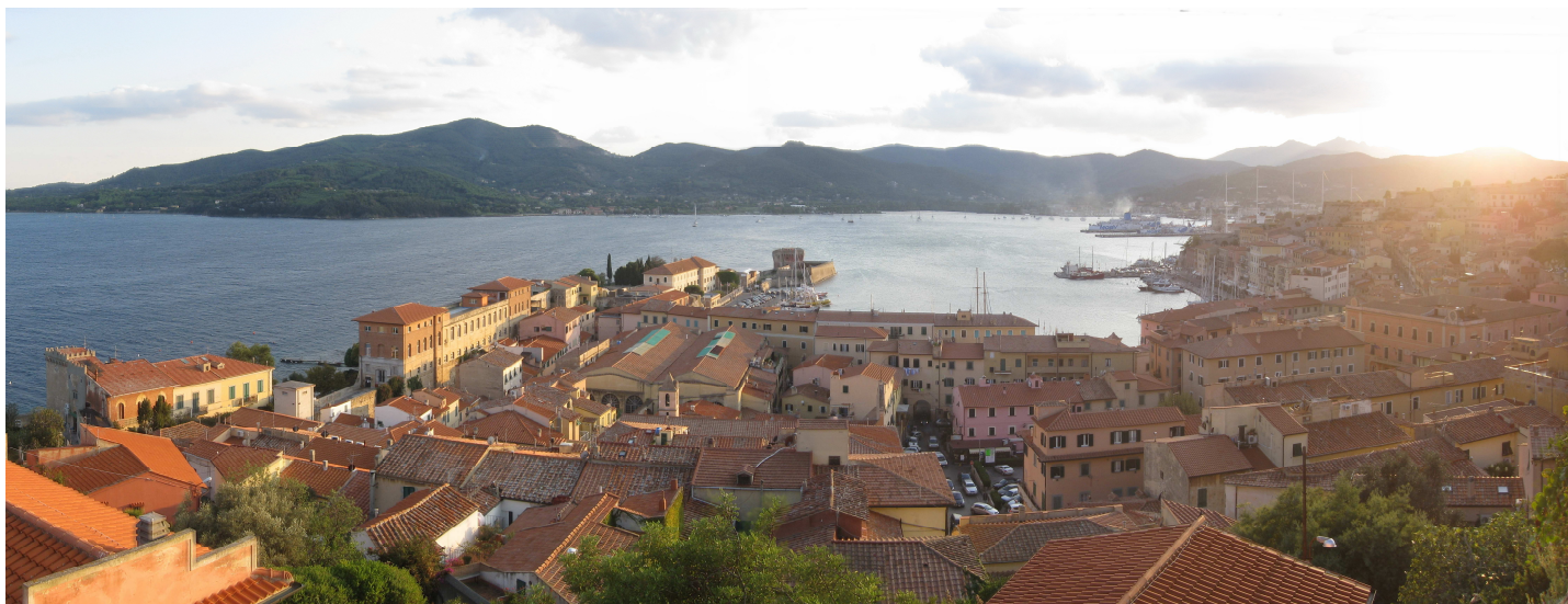
1. Portoferraio, Isola d'Elba

L'objectif que le LAB.net plus est de réaliser est suggéré par l'intérêt croissant pour la combinaison entre Paysages, Environnement