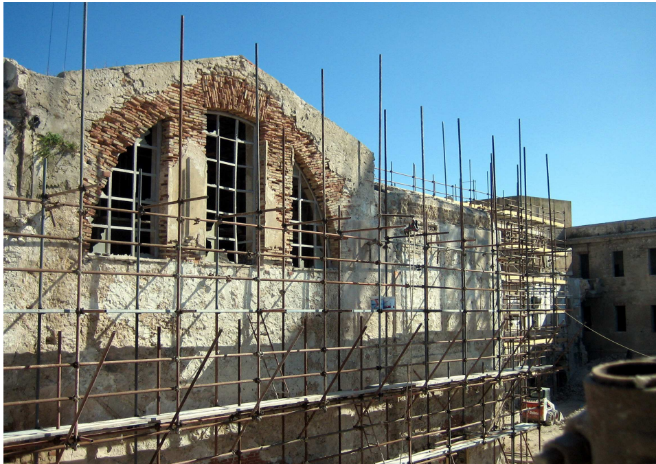
2. Un cantiere di recupero nel centro storico di Alghero.

I destinatari delle azioni del progetto LAB.net plus saranno gli amministratori, i tecnici locali, i progettisti specializzati nella valorizzazione del paesaggio e nel recupero del patrimonio costruito storico, gli operatori nel campo della gestione del patrimonio culturale (artigiani, muratori, costruttori, produttori di materiali edili), gli insegnanti e gli studenti, le popolazioni dei territori coinvolti.